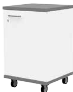
ЛАБ-М ТПМД 50.50.81 500×500×810 мм