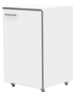
ЛАБ-М ТПД 50.50.81 500×500×810 мм