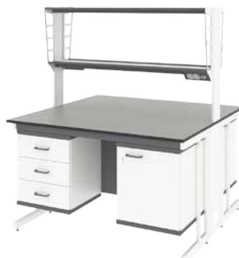
ЛАБ-М СОЦв 150.150.90 TR6 + ЛАБ-М ТНМД 50.50.60 + ЛАБ-М ТНМЯ3 50.50.60 + ЛАБ-М СтО 150.48.90