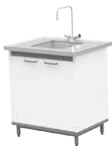
ЛАБ-М МО МЕ 80.65.90 SS