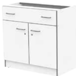
ЛАБ-М ТОДЯ1 86.50.86