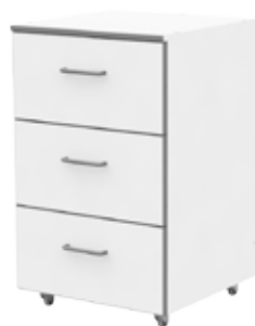
ЛАБ-М ТПЯЗ 50.50.81 500×500×810 мм