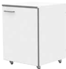
ЛАБ-М ТПД 50.50.67 500×500×670 мм