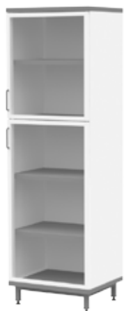
ЛАБ-М ШМП 60.50.194 (600×500×1940мм)