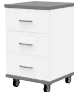
ЛАБ-М ТПМЯЗ 50.50.81 500×500×810 мм