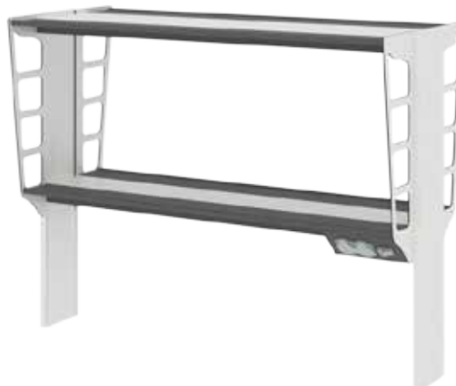
Стеллаж ЛАБ-М СтО 120.48.90 в базовой комплектации