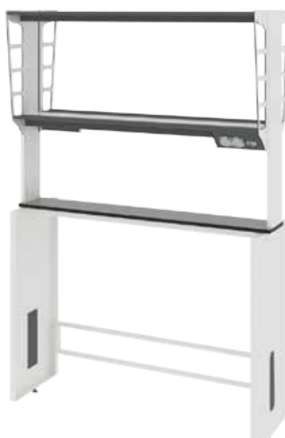
Технологическая стойка островная ЛАБ-М ТСО 120.20/48.90/180 в базовой комплектации