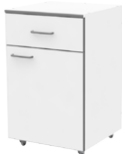
ЛАБ-М ТПДЯ 50.50.81 500×500×810 мм