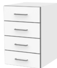
Тумбы с 4 ящиками