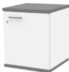
ЛАБ-М ТНМД 50.50.60/ 500×500×600 мм