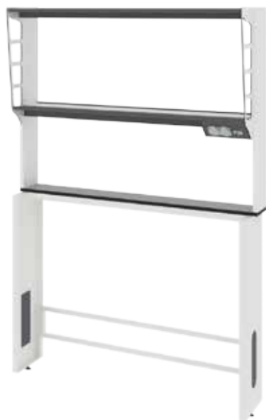
Технологическая стойка пристенная ЛАБ-М ТСП 120.15/32.90/180 в базовой комплектации