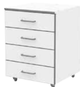
ЛАБ-М ТПЯ4 50.50.67 500×500×670 мм