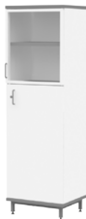
ЛАБ-М ШМД 60.50.194 (600×500×1940мм)