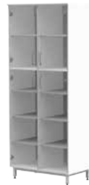
ЛАБ-М ШП 80.50.194 (800×500×1940мм)