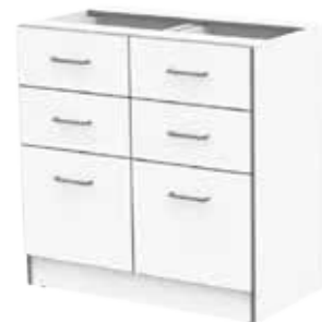
ЛАБ-М ТОЯ6 86.50.86