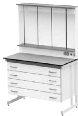
ЛАБ-М СТ 120.65.90/180 TR6 + ЛАБ-М ТЯ4 110.50.60