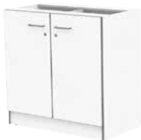
ЛАБ-М ТОДД 86.50.86