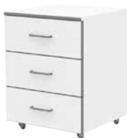
ЛАБ-М ТПЯЗ 50.50.67 500×500×670 мм