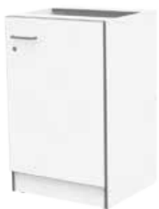
ЛАБ-М ТОЯ 54.50.86