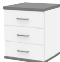
ЛАБ-М ТНМЯЗ 50.50.60/ 500×500×600 мм