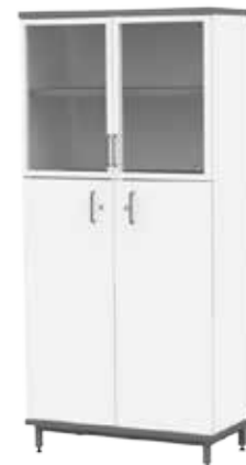
ЛАБ-М ШМД 90.50.194 (900×500×1940мм)