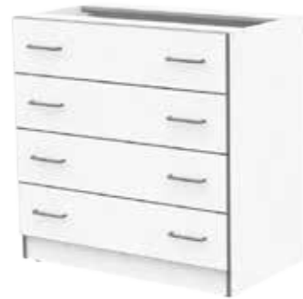
ЛАБ-М ТОЯ4 116.50.86