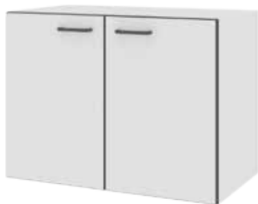
Тумбы с дверкой

Тумбы шириной 800 мм предназначены только для комплектации столов на металлокаркасе ЛАБ-М длиной 900 мм; тумбы шириной 1100 мм предназначены только для комплектации столов на металлокаркасе ЛАБ-М длиной 1200 мм