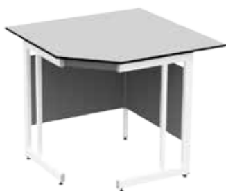
ЛАБ-PRO СУ 110/80.110/80.90 TR6