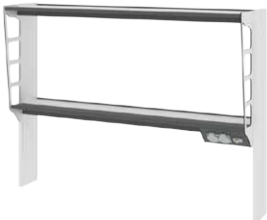
Стеллаж ЛАБ-М СтП 120.32.90 в базовой комплектации