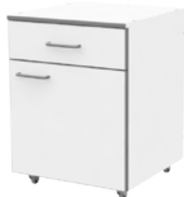
ЛАБ-М ТПДЯ 50.50.67 500×500×670 мм