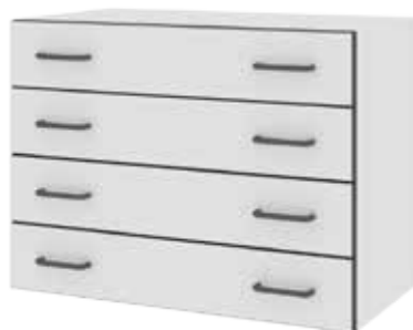
Тумбы с 4 ящиками