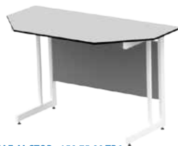
ЛАБ-М СТОРв 150.75.90 TR6