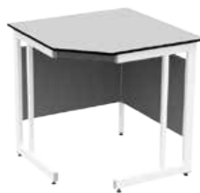
ЛАБ-PRO СУ 90/65.90/65.75 TR6