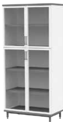
ЛАБ-М ШМП 90.50.194 (900×500×1940мм)