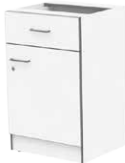
ЛАБ-М ТОДЯ1 54.50.86