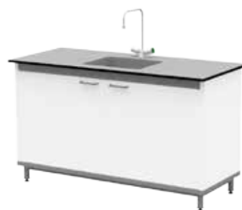
ЛАБ-М МО МЕ 150.65.90 TV