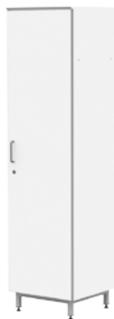
ЛАБ-М ШО 50.50.194 (500×500×1940мм)