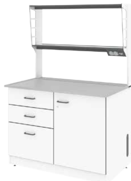
ЛАБ-М ТОДЯЗ 116.50.86 + ЛАБ-М РП 120.65 VI + ЛАБ-М ТСП 120.15/32.90/180