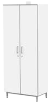
ЛАБ-М ШР 80.50.194 (800×500×1940мм)