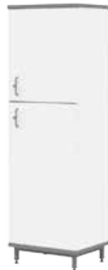
ЛАБ-М ШМЛ 60.50.194 (600×500×1940мм)