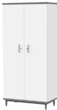
ЛАБ-М ШМР 90.50.194 (900×500×1940мм)