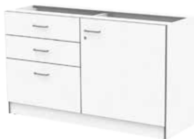
ЛАБ-М ТОДЯЗ 146.50.86