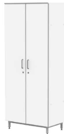
ЛАБ-М ШО 80.50.194 (800×500×1940мм)