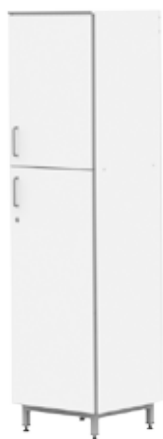
ЛАБ-М ШЛ 50.50.194 (500×500×1940мм)