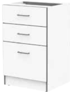
ЛАБ-М ТОЯЗ 54.50.86