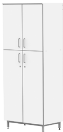
ЛАБ-М ШЛ 80.50.194 (800×500×1940мм)