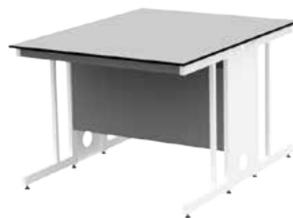
ЛАБ-М СОЦв 150.150.90 TR6