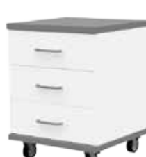
ЛАБ-М ТПМЯЗ 50.50.67 500×500×670 мм