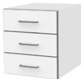
Тумбы с 3 ящиками