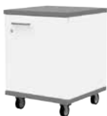
ЛАБ-М ТПМД 50.50.67 500×500×670 мм