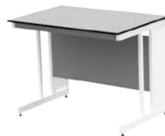
ЛАБ-М СПЦв 150.80.90 TR6