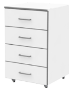
ЛАБ-М ТПЯ4 50.50.81 500×500×810 мм