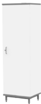
ЛАБ-М ШМР 60.50.194 (600×500×1940мм)