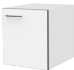
Тумбы с дверкой