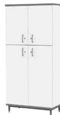
ЛАБ-М ШМЛ 90.50.194 (900×500×1940мм)